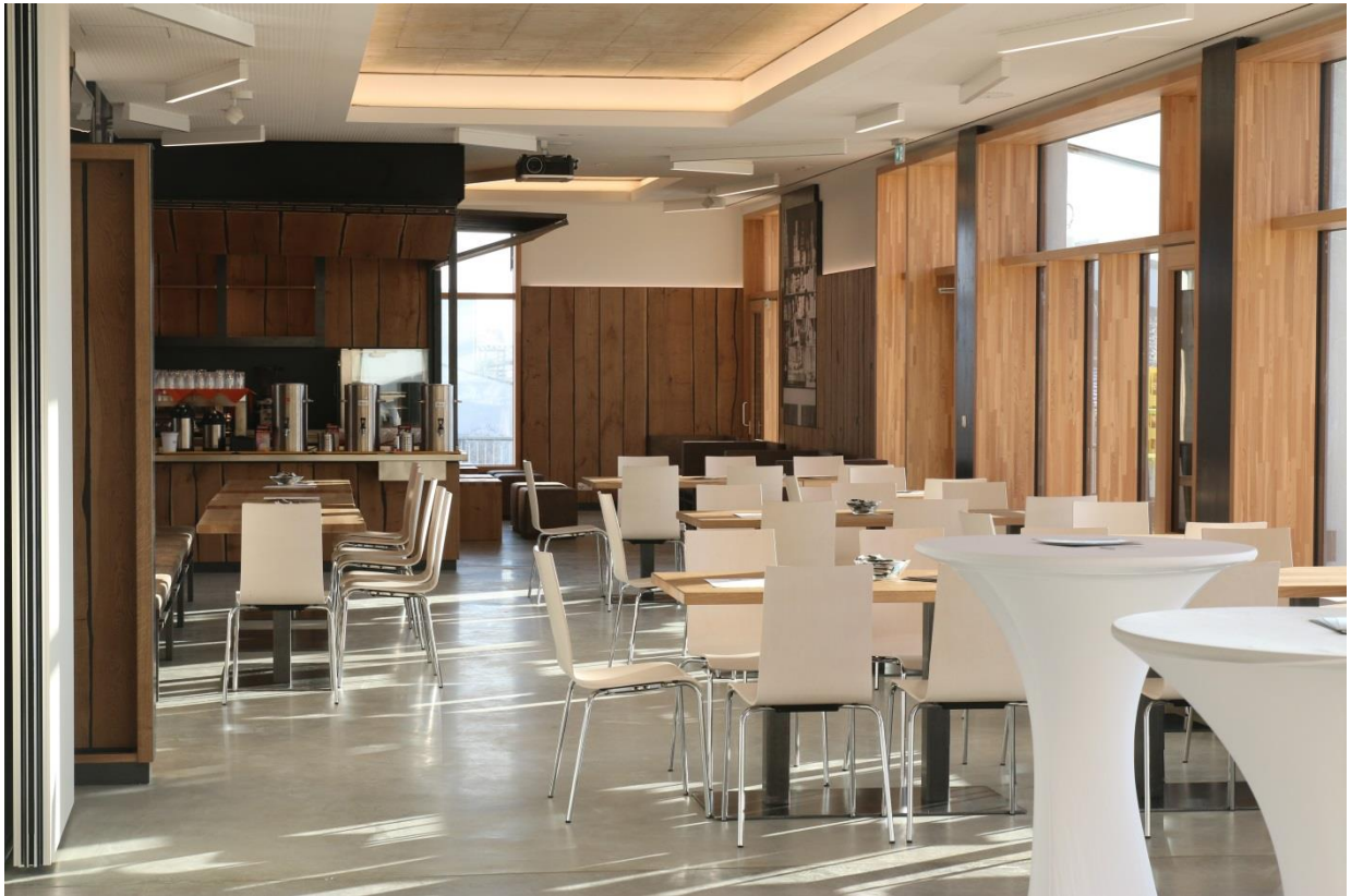
Gastraum des W5-Café und Bistro mit geöffnetem Foyer